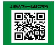
↓申込フォームはこちら