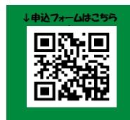
↓申込フォームはこちら